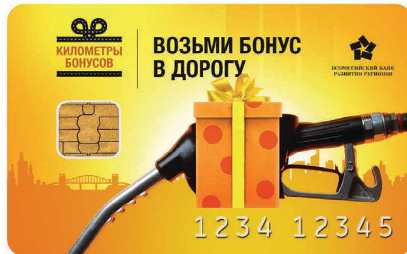
Кейвижуал и карта