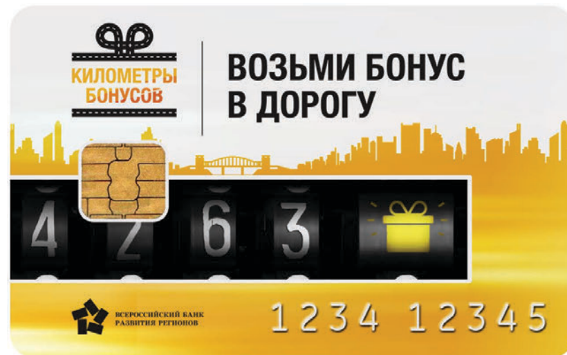
Кейвижуал и карта