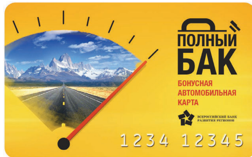
Кейвижуал и карта

Приобретая топливо, товары народного потребления и услуги на автозаправочных комплексах НК «Роснефть» с картой «ПОЛНЫЙ БАК», Вы автоматически становитесь участником Акции, а значит, можете накапливать бонусы и тратить их на дополнительные литры топлива.